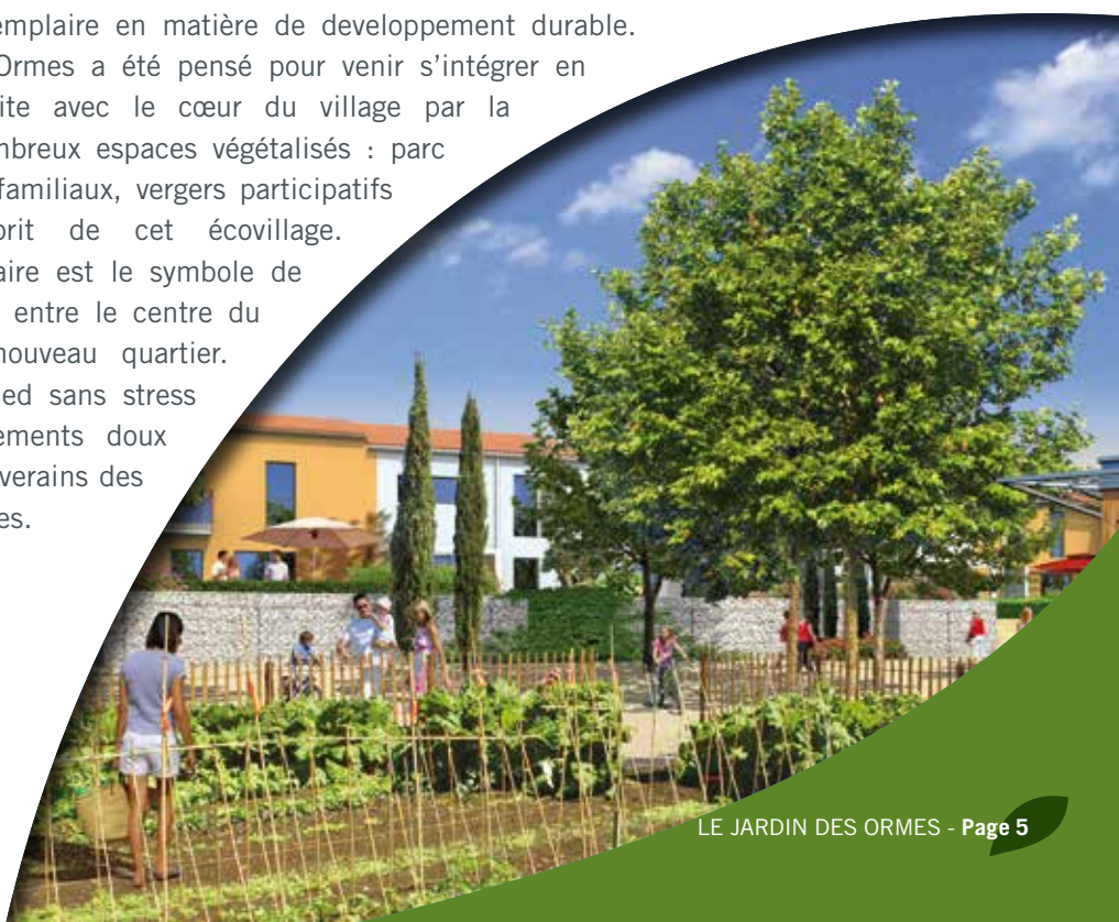
Les jardins familiaux

Le Jardin des Ormes a été conçu pour le bien-être de tous et plus particulièrement des enfants en pensant à leur avenir. Ce projet d'aménagement a obtenu la certification « HQE Aménagement » qui se veut exemplaire en matière de développement durable. Le Jardin des Ormes a été pensé pour venir s'intégrer en harmonie parfaite avec le cœur du village par la création de nombreux espaces végétalisés : parc urbain, jardins familiaux, vergers participatifs insufflent l'esprit de cet écovillage. Le groupe scolaire est le symbole de cette continuité entre le centre du village et le nouveau quartier. On circule à pied sans stress et les cheminements doux préservent les riverains des nuisances sonores.