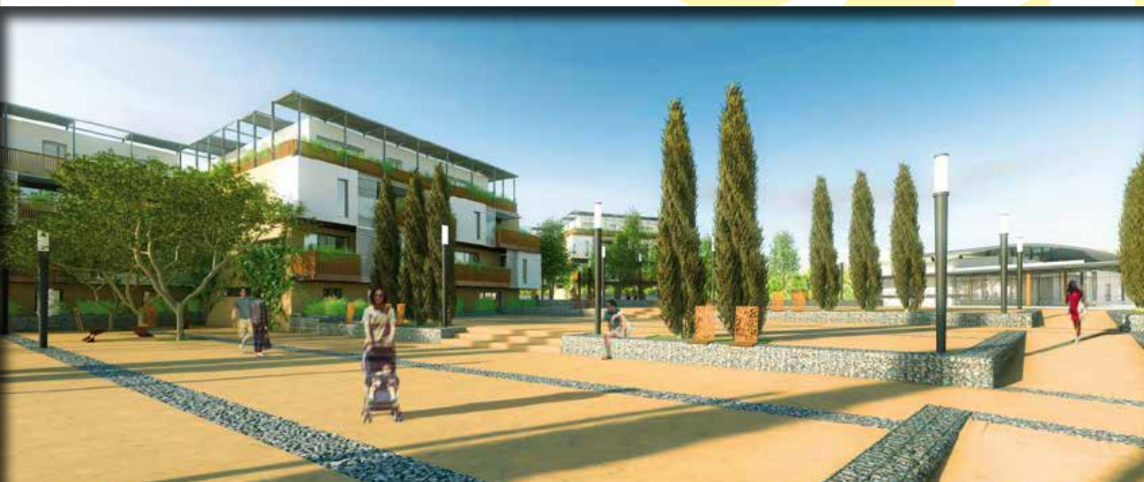
Vue du parc public

Le Jardin des Ormes a été conçu pour le bien-être de tous et plus particulièrement des enfants en pensant à leur avenir. Ce projet d'aménagement a obtenu la certification « HQE Aménagement » qui se veut exemplaire en matière de développement durable. Le Jardin des Ormes a été pensé pour venir s'intégrer en harmonie parfaite avec le cœur du village par la création de nombreux espaces végétalisés : parc urbain, jardins familiaux, vergers participatifs insufflent l'esprit de cet écovillage. Le groupe scolaire est le symbole de cette continuité entre le centre du village et le nouveau quartier. On circule à pied sans stress et les cheminements doux préservent les riverains des nuisances sonores.